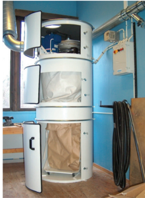
Ventilator, filter og affaldssæk.