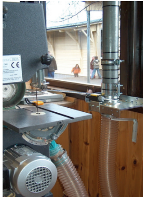
Udsugning direkte ved maskine.

Spånudsugeren består af et cylindrisk kabinet bestående af 4 afsnit holdt sammen med klembeslag. Øverst er ventilatoren og under den finder man en tekstilfilterpose. De filtrerede urenheder falder ned i den nedre filterpose mens de fine partikler fanges af tekstilfilteret der rystes i intervaller så støvet også falder ned i papirposen.