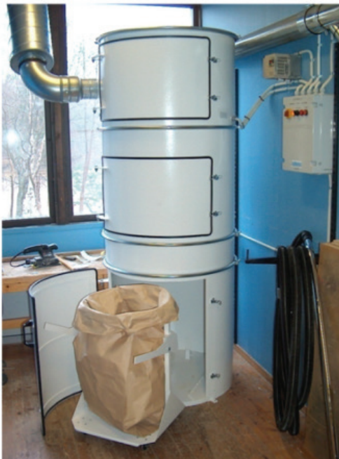
Tømning af affaldssæk.