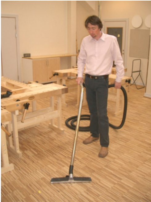
Støvsugning i værksted eller sløjdlokale.